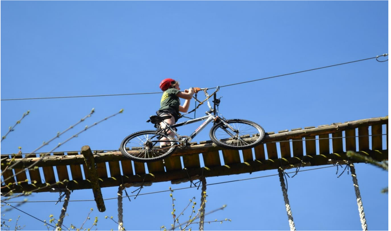
NIH klatrebane 2015