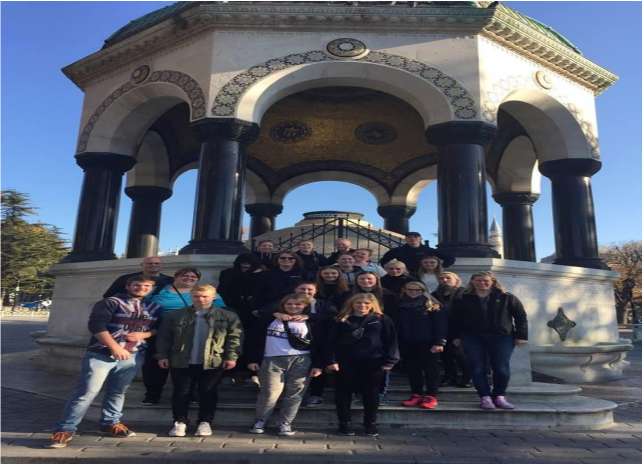
Billede fra 2.p's studietur