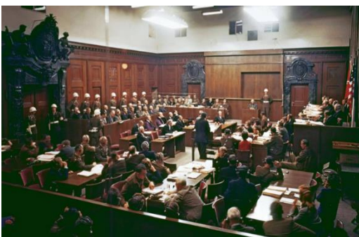
Hvordan man tror en retssals ser ud

”Vi bliver derefter ført ind i en anden retssal, hvor vi får at vide, at den næste sag handler om en ung mand, der har banket sin kæreste i Aalborgs natteliv. Det er utroligt spændende at se, hvordan sådan noget foregår. Det overraskede på mange måder, da vi nok havde forestillet os,