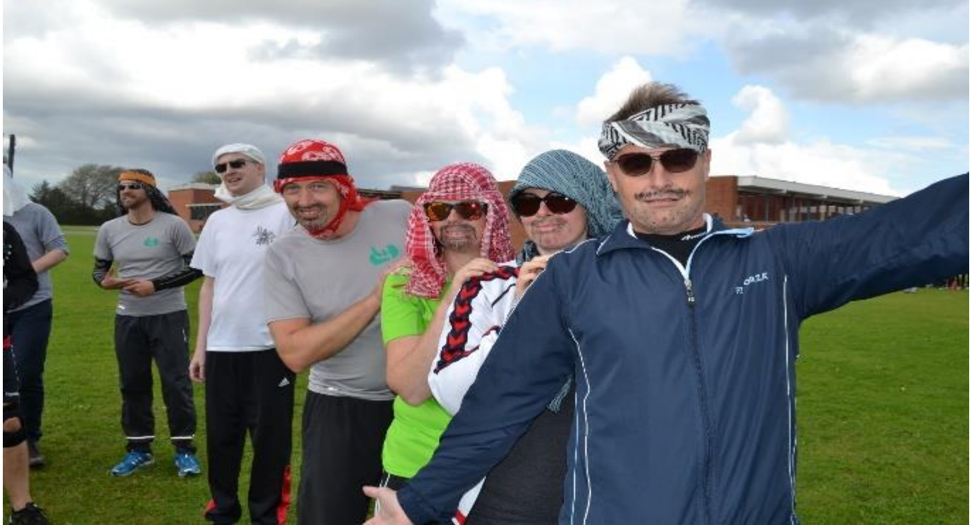
Lærerenes udklædning til idrætsdagen 2015