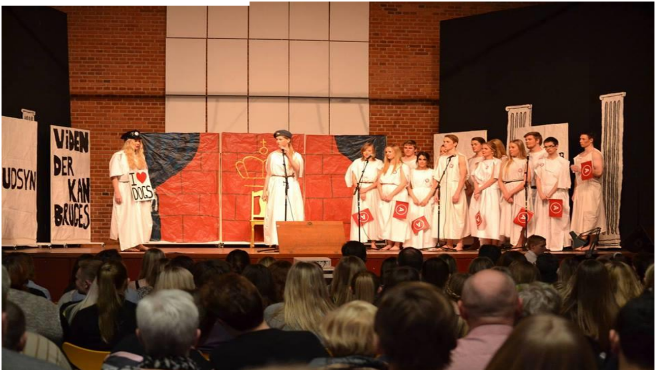
BG revyen 2016