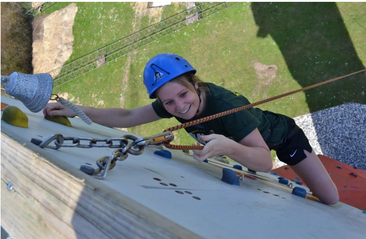
NIH klatremur 2015