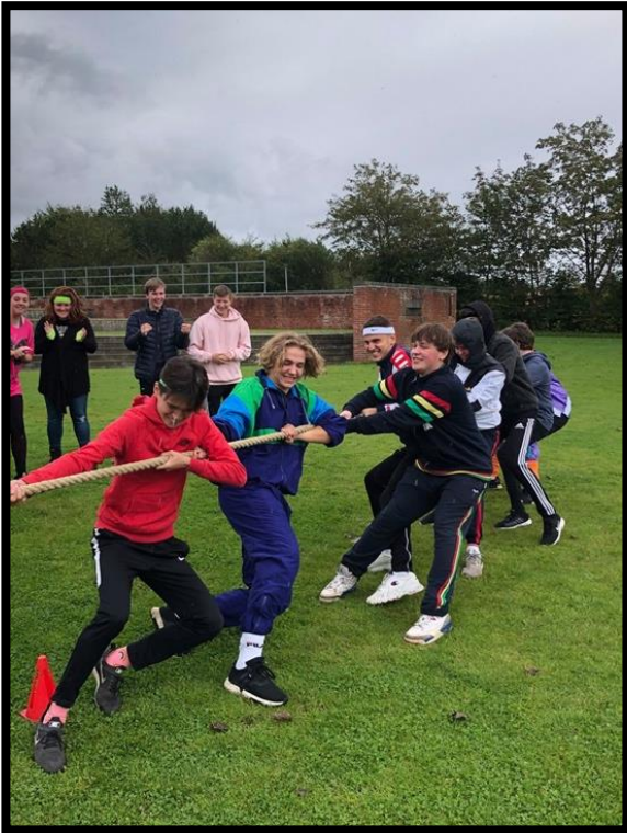
BG omstrukturerer traditionsrig idrætsdag